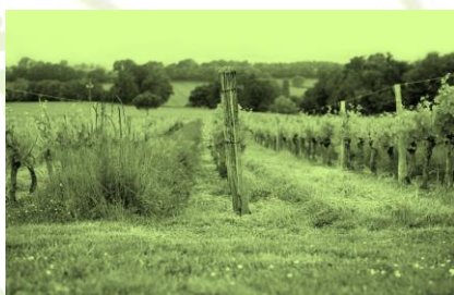
Les Vignerons de Buzet

Evaluation de l'ancrage territorial en région Nouvelle-Aquitaine de la cave coopérative